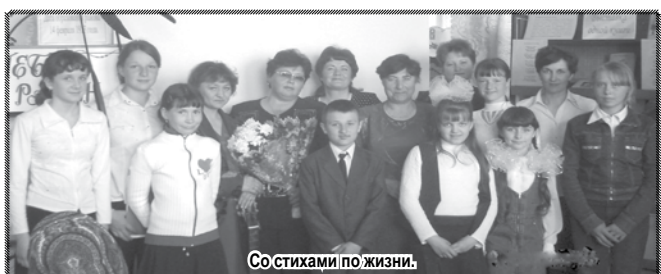
Со стихами по жизни.