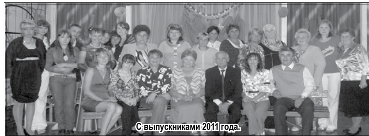
С выпускниками 2011 года.