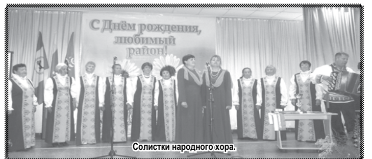
Солистки народного хора.

Зародился творческий дуэт в 1982 году - это время движения агитбригад,