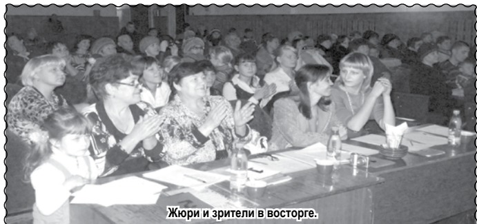
Жюри и зрители в восторге.