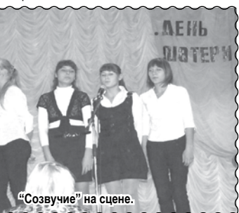
«Созвучие» на сцене.