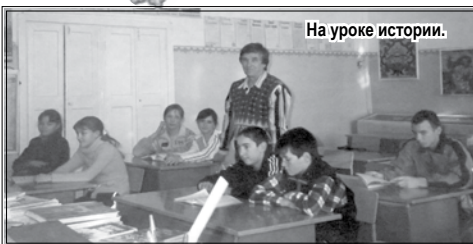
На уроке истории.

Автор: консультант газеты Пономаренко Андрей Николаевич.