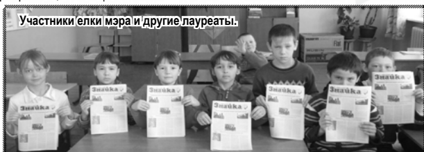
Участники елки мэра и другие лауреаты.