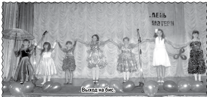
Выход на бис.

Последнее воскресенье ноября знаменательно тем, что, в этот день в России отмечается прекрасный праздник - День Матери.