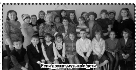
Если дружат музыка и дети.