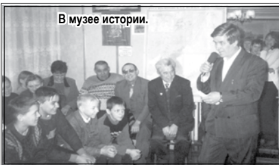
В музее истории.