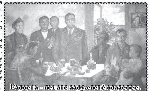
Музей в Кимильтейской школе.

и останутся люди. Будем помнить замечательных людей и их заслуги.