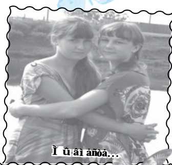
І ў аі аноа...

Что такое лето – это лагерь. Лагерь и играющие дети. Межестра, вожатые, директор, воспитатель, Лагерь – это бодрость и веселье.