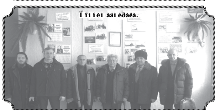
І і і ёі ёаі ёдаёа.