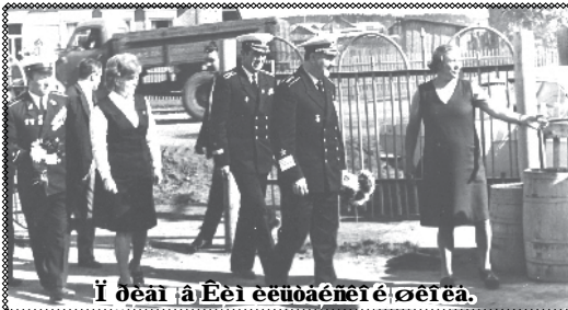
Идеалы Советского Союза.