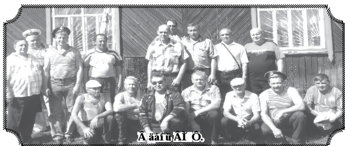
А ааі ў АІ О.