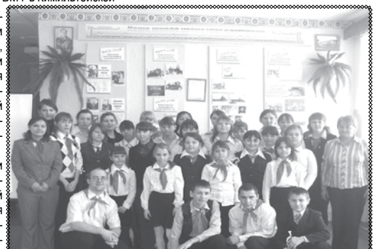
Историко-краеведческий музей в Кимильтейской школе.

Автор: консультант газеты «Знайка» Пономаренко Андрей Николаевич.