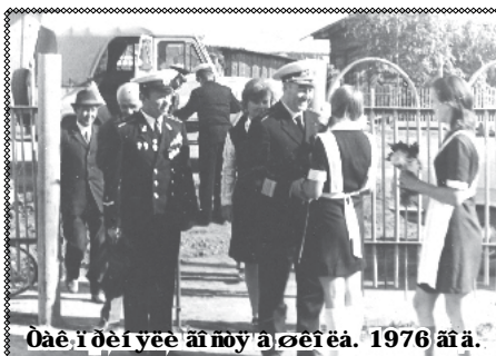
Одним из первых в войну. 1976 г.