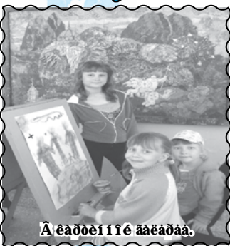
А ёаёеі і іё аёёаёа.

Вот и закончился летний сезон. Родители, ученики и учителя готовятся вступить в свой новый учебный год. Но каждый человек вольно или невольно вспоминает летние дни отдыха.