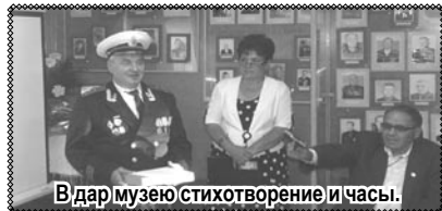
В дар музею стихотворение и часы.