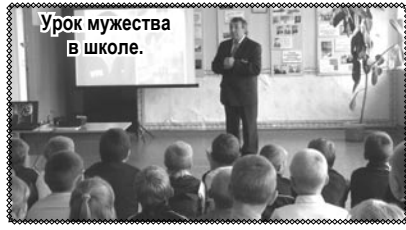
Урок мужества в школе.