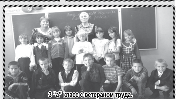
3 "а" класс с ветераном труда.

Не сомневаемся, что наступит день, когда об учителях Кимильтейской средней