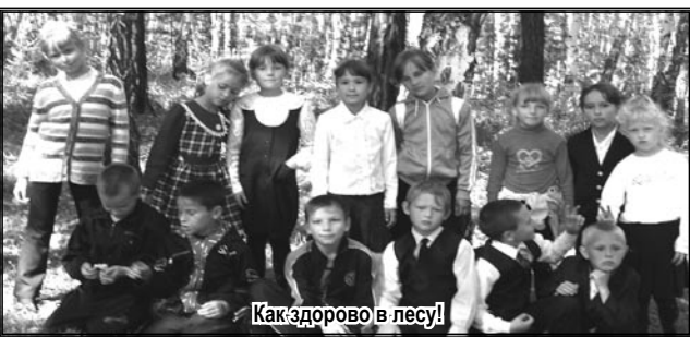
Как здорово в лесу!