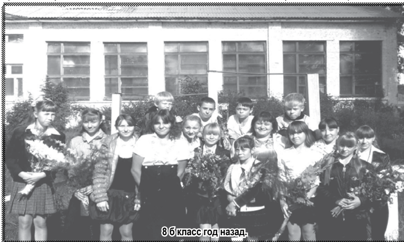
8 б класс год назад.

Автор: учитель русского языка и литературы МБОУ Кимильтейская СОШ Кутина Нина Васильевна.