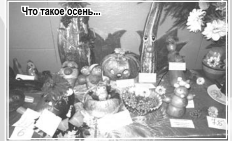
Что такое осень...

1 сентября 2012 года. Тёплый солнечный денёк. Жёлтые листья берёз, красивые цветы в палисаднике. У природы словно праздник! Праздник и у меня, потому что я буду учить мой первый класс. Моих маленьких, дорогих ребят. 1 сентября особый праздник для наших дорогих первоклассников и их родителей. В этот день они вступают на длинную и трудную дорогу, где столкнутся с трудностями, переживут радости от первой пятёрки и прольют слёзы от первой двойки. Надеюсь, что эта дорога будет для ребят интересной и увлекательной.