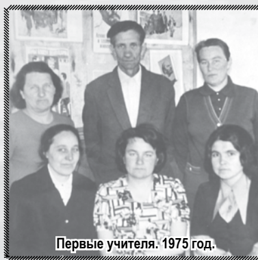
Первые учителя. 1975 год.