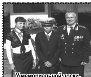
У мемориальной доски.