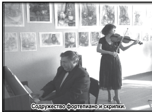
Содружество фортепиано и скрипки.

Автор: преподаватель ДШИ Новобрицкая Елена Дмитриевна.