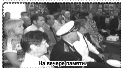
На вечере памяти.