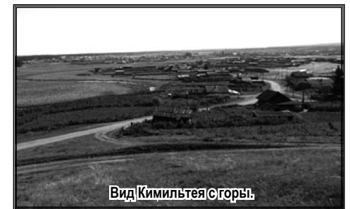
Вид Кимильтея с горы.