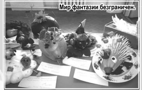
Мир фантазии безграничен.