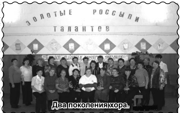
Два поколения хора.