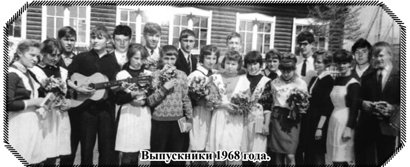
Выпускники 1968 года.