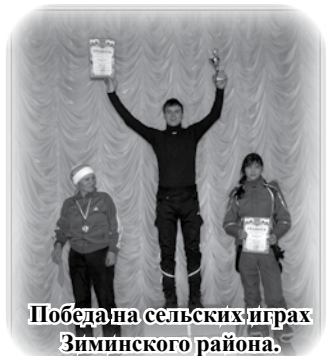
Победа на сельских играх Зиминского района.

Автор: консультант газеты Пономаренко Андрей Николаевич.