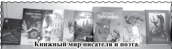
Книжный мир писателя и поэта.