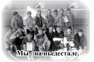
Мы – на пьедестале.