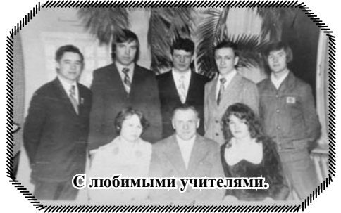
С любимыми учителями.

шли с нами до десятого класса и некоторые также бываю с нами на встречах. Хотелось отметить, что из нашего выпуска, все нашли свою дорогу, профессию, создали семьи, у всех есть дети и уже внуки, а у двоих и правнуки. А если говорить о профессиях то у нас есть экономисты, бухгалтер, инженеры, руководители предприятий, работники госучреждений и профсоюзных, медицинские работники и конечно, преподаватели и учителя в школе, техникуме, а также пекарь и связисты. Одним словом, никто не