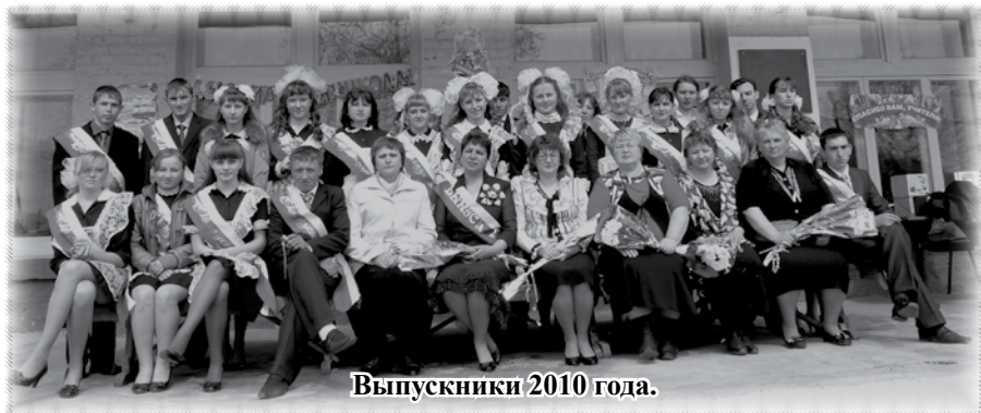
Выпускники 2010 года.