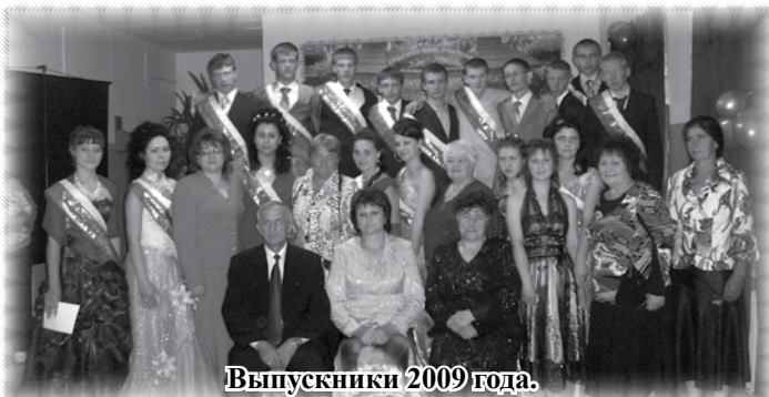
Выпускники 2009 года.

Автор: Сибатулина Ольга Николаевна, методист межпоселенческой центральной библиотеки Зиминского района.