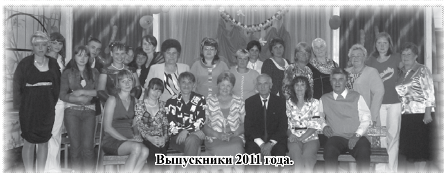
Выпускники 2011 года.