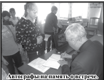
Автографы на память о встрече.