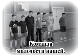
Команда молодости нашей.

Турнир в память о заслуженном тренере М.В. Солдатове. 5 км. 1 место.