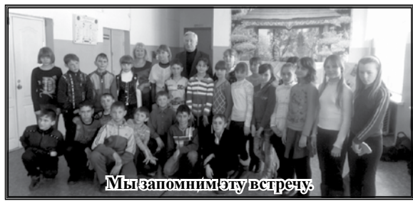
Мы запомним эту встречу.