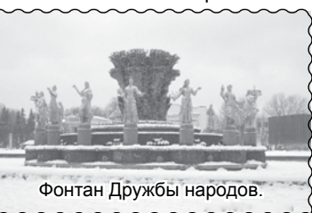
Фонтан Дружбы народов.

Зимние каникулы мы провели в Москве. Первое впечатление о Москве было, на котором крупными светящимися буквами было написано «Москва». Даже не верилось, что мы находимся в столице России.