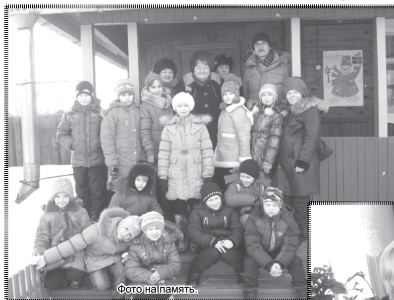
Фото на память.

В тёплый зимний день учащиеся 3 а класса вместе со своими родителями впервые посетили Дом – музей поэзии в городе Зима. Встреча действительно была долгожданная. При встрече ребят и взрослых ожидал приятный сюрприз. У ворот их встретили хозяева Дома поэзии, которые провели обряд старины преданий «Воротами желаний». Все желающие получили возможность загадать самые заветные желания, и думается,