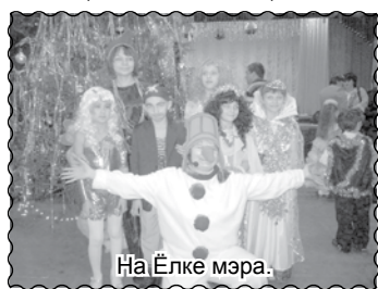
На Ёлке мэра.

и все такие нарядные, у всех всевозможные новогодние костюмы, много стихов знают дети, да вообще всё было отлично. Мы ездили вместе с мужем и нам очень понравилось.