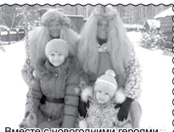
Вместе с новогодними героями.

что трудно передать словами. Сказочные герои организовали для детей игры. Детскому восторгу не было предела. Все дети активно