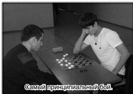
Самый принципиальный бой!

спартакиаде среди предприятий Зиминского района победу одержала команда выпускников Кимильтейской школы, которые вырвали победу у спортсменов СПК «Окинский» по итогам состязаний по настольному теннису и гиревому спорту.