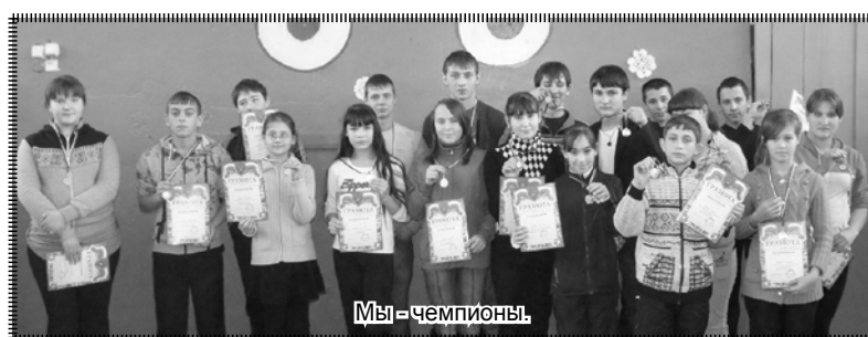
Мы – чемпионы.

Автор: консультант газеты «Знайка» Пономаренко Андрей Николаевич.