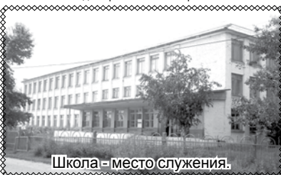
Школа - место служения.

требовательная к себе, воспитывает в своих учениках трудолюбие и заботу о людях. На занятиях кружка под умелым руководством своей учительницы ребята делают замечательные поделки, которые занимают призовые места на районных выставках. Эта обаятельная учительница очень внимательна и чутка к своим воспитанникам.