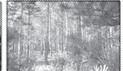
Красота Кимильтейского леса.

носится к своим родителям. Об этом можно прочитать в её стихотворении «Пожелания родителям»: