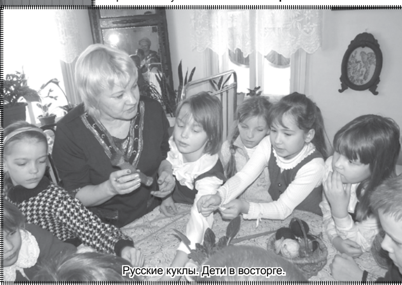
Русские куклы. Дети в восторге.