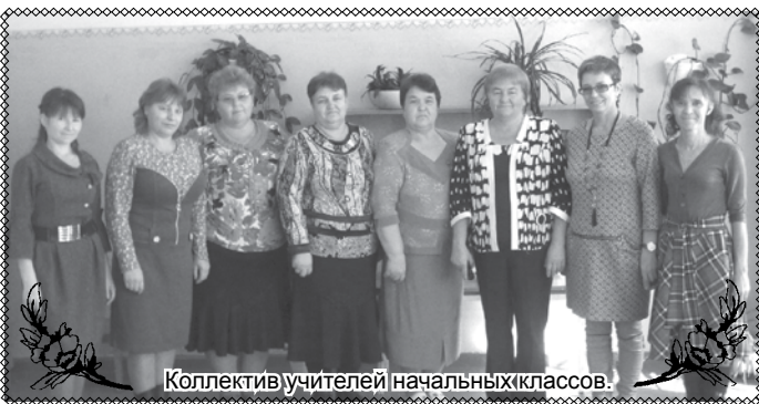
Коллектив учителей начальных классов.

Автор: учитель русского языка и литературы Антоненко Мария Андреевна.